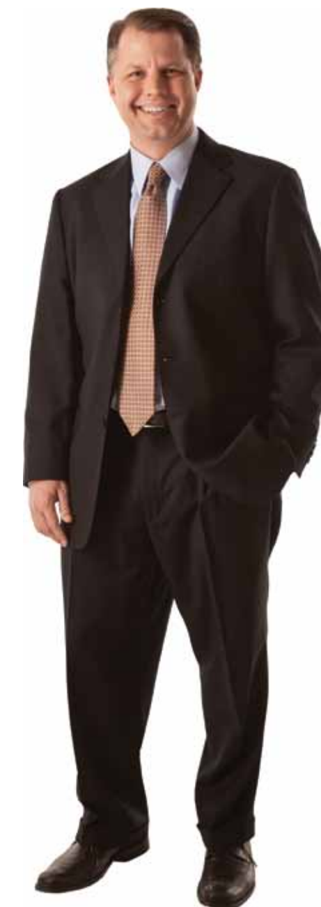
Владелец, Президент и Исполнительный Директор Zeeco, Inc.

Zeeco явно выделяется из массы. И лучшее у нас ещё впереди.